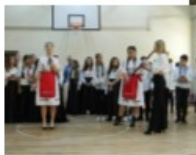
Garda civică voluntară