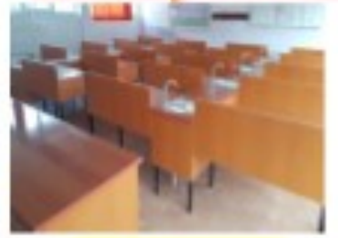
Sală de clasă