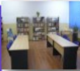
Centrul de Documentare și Informare