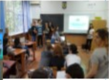
1 decembrie 2018