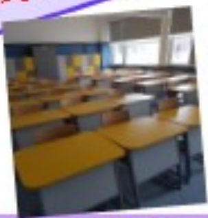
Laboratoare de informatică