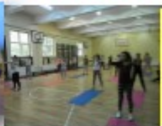
Sală de sport