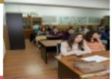
Laboratoare de biologie